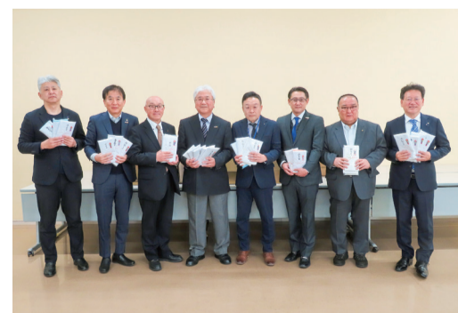
第4分区A太田5ロータリークラブより