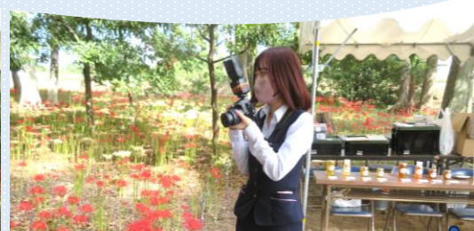
早川淵彼岸花の里公園に協賛