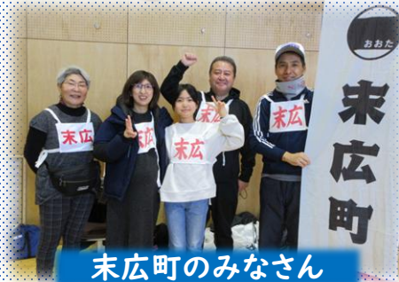
末広町のみなさん