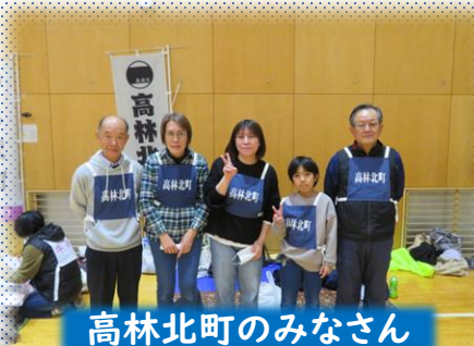
高林北町のみなさん