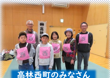
高林西町のみなさん