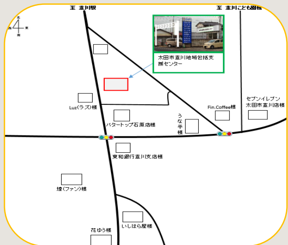
葦川包括支援センター リーフレット