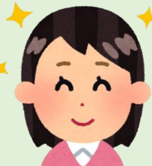
藪塚地区担当 コーディネーター

笑いもあり、藪塚らしい和やかな雰囲気で開催することができました。参加していただいた皆さんが、自分の身の回りにある“地域のお宝”に気づくきっかけになればいいなと思います！今後も藪塚地区のお宝を探し、発信していきたいです♪