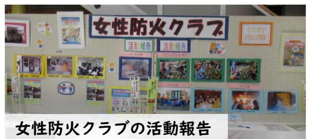
女性防火クラブの活動報告

太田市社会福祉協議会では、太田市全地区で「つながる通信」を発行しています。右のQRコードを読み取ると、これまでに発行された「つながる通信」をご覧いただけます。