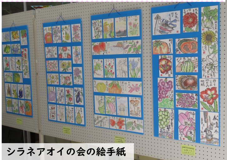
シラネアオイの会の絵手紙