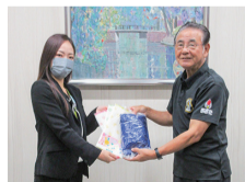
明治安田生命 西太田営業所より