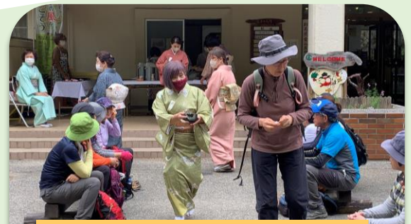
お茶と和菓子を提供する なつめの会の皆さん

ゴール地点の東毛青少年自然の家では、 なつめの会の皆さん から野だてのお茶と和菓子の提供、野外炊事場では、 ボーイスカウトの保護者 から豚汁の提供があり、参加者は自然の中で食事を楽しみました。