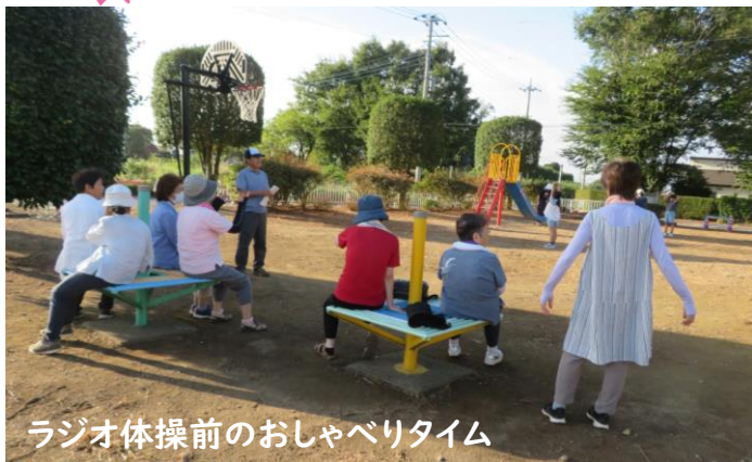
ラジオ体操前のおしゃべりタイム