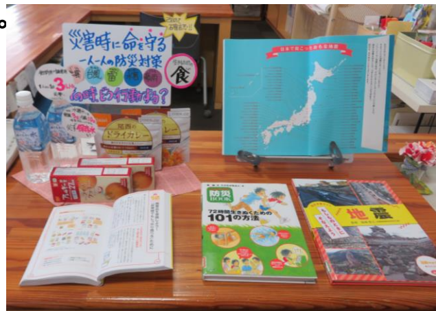
図書室の災害に関するコーナー

令和5年度はJRC委員会、安全委員会の1・2年生50人と綿打地区民生委員が参加し「自然災害が起きたときの行動について考えよう(その時あなたは どうしますか)」と題し、民生委員と交流しながら生徒ひとりひとりが考え、自分の意見を発表する形で行われました。