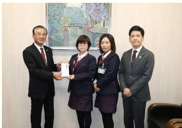
両毛ヤクルト販売(株) 様