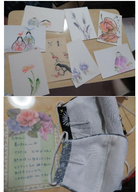
絵はがきと娘さんお手製のマスク