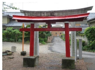
鮮やかによみがえった鳥居

いいとこ西矢島町長寿健康家族はふとしたきっかけに、町民の皆さんが、「西矢島町は、いいとこだな。」と思えるまちづくりを進めています。