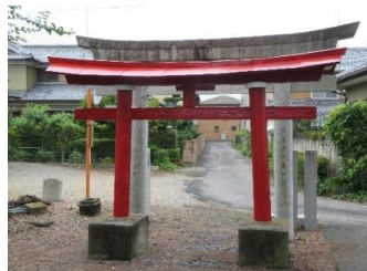
鮮やかによみがえった鳥居

いいとこ西矢島町長寿健康家族はふとしたきっかけに、町民の皆さんが、「西矢島町は、いいとこだな。」と思えるまちづくりを進めています。