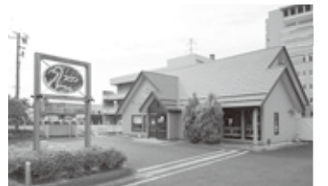
太田市役所すぐ南、スワンの看板が目印です。