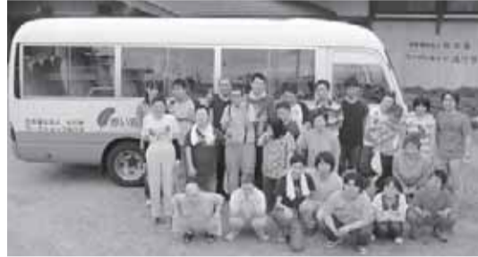
車輦配分事業（ワークショップありす）