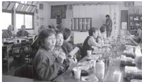
宝泉地区 協屋いきいきサロンの様子

◎「歳末たすけあい運動」は、地域住民やボランティア、区長会、民生・児童委員、社会福祉施設、各地区社会福祉協議会等の協力に