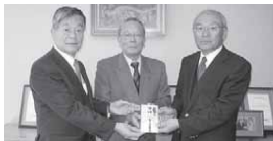
歳末たすけあいチャリティーゴルフ大会 チャリティー基金贈呈

より、新たな年を迎える時期に、支援を必要とする人たちが地域で安心して暮らすことができるよう、さまざまな福祉活動を重点的に展開するものです。 昨年の歳末時期には、地区社協歳末時期慰問交流事業、身障施設等で行われるクリスマスパーティーへ配分致しました。この他、地域で実施される通年事業（高齢者・子育て・障がい者サロン事業等）へ配分される予定です。